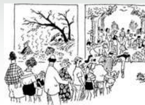
Рисунок Била Тайди, английские общественные леса